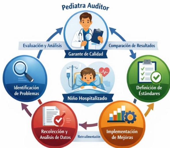
Figura 1. El pediatra auditor como gestor de cambio hacia la mejora de la calidad de la atención al niño hospitalizado.